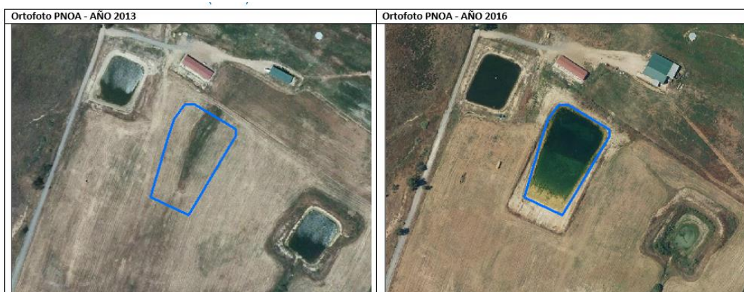
Figura 1. Ejemplo de comparativa entre ortofotografía de 2013 y 2016 del PNOA.

El análisis se ha basado en la utilización de técnicas de teledetección, usando como fuente de datos principal ortofotografía aérea del PNOA (Plan Nacional de Ortofotografía Aérea) y utilizando como apoyo imágenes tomadas por el satélite Landsat 8, así como visitas de campo por parte de los técnicos de la organización. A partir de la fotointerpretación sobre ortofotografía aérea de los años 2013 y 2016, y el apoyo de imágenes de satélite en color infrarrojo de 2014, 2015 y 2016, se ha analizado las balsas nuevas ejecutadas en dicho periodo.